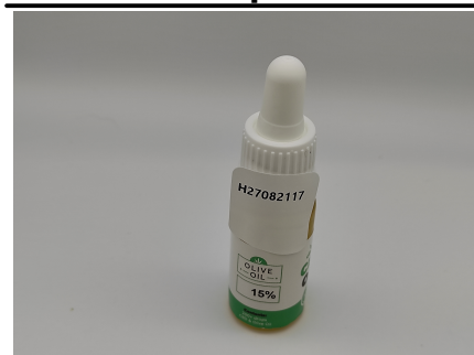
Foto del campione