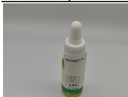
Foto del campione